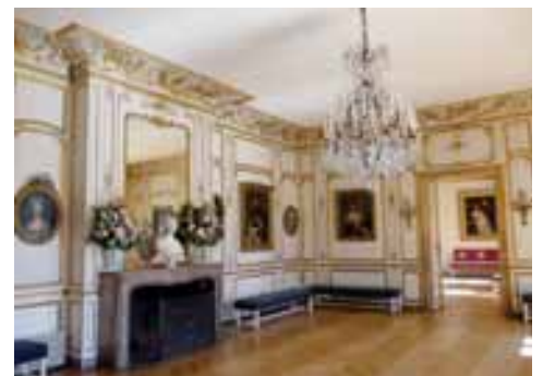
● Märchenhaftes Schloss Breteuil

Stille Beschaulichkeit mit rustikaler Note auf hohem Niveau eröffnet das Land-Schloss Villiers le Mahieu & Spa: das weitläufige Areal mit dem trutzigen Schloss beherbergt weiters ein stilvolles Landhaus, eine exquisite Spa-Landschaft, dazu Golfplatz und eigenen Hubschrauberlandeplatz. Eine komplette Destination mit Seminar-, Veranstaltungs- und Nächtigungs-Möglichkeiten – und das rund 30 Minuten von Paris entfernt. In etwa gleicher Reichweite liegt die ehemalige Zisterzienser-Abtei Vaux de Cernay, nunmehr ein Luxushotel der „Hôtels particuliers“, dessen Räumlichkeiten gleichzeitig klösterliche Strenge und dezenten Luxus vermitteln. Sprichwörtlich märchenhaftes Ambiente empfängt den Besucher im Privatschloss Breteuil: Schlossbesitzer Marquis Henri-François de Breteuil persönlich führt durch die in schlichter Eleganz gehaltenen Räumlichkeiten und unterhält mit launigen Geschichten seiner Vorfahren, einer davon war sogar französischer Botschafter bei unserer Kaiserin Maria Theresia. Sein besonderer Stolz gilt den liebevoll arrangierten Märchenfiguren, die bei privaten Veranstaltungen im Schloss in Szene gesetzt werden können. Dafür ist das gesamte Schloss inklusive Marquis zu mieten. MS ■