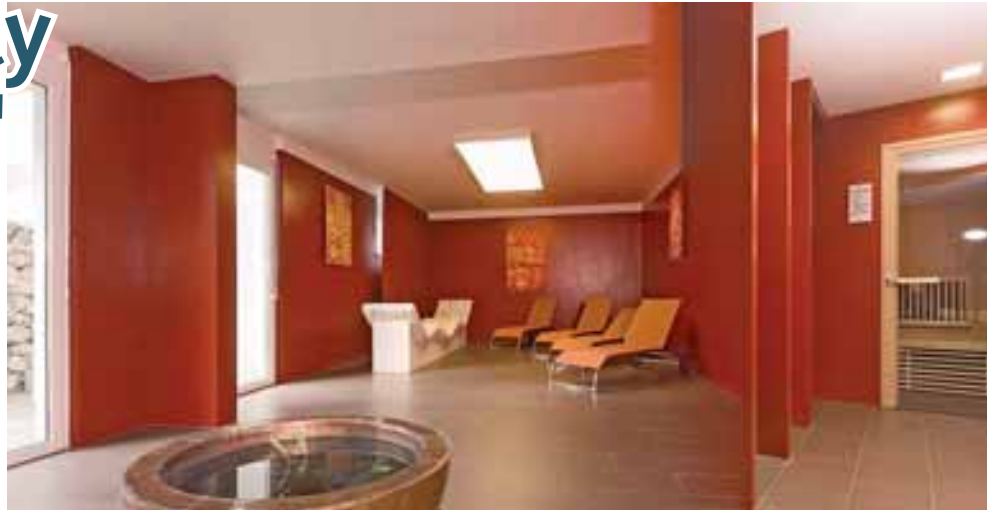
Das Boarding House „OrchideenPark“ ist mit modernsten Wellness- und Fitness-Einrichtungen, einem großzügigen Outdoor-Pool und Concierge-Services ausgestattet

Die wachsende Nachfrage nach City Apartments wird sowohl von zufriedenen Betreiber-Statements belegt als auch von der stetigen Ausweitung der Unterkunftspalette, die sich ganz auf die Bedürfnisse von Geschäftsreisenden mit längerem Aufenthalt außerhalb der Grenzen der Erreichbarkeit ihrer Wohnstätte ausgerichtet haben. „Länger“ ist dabei ein variabler Begriff, der zumeist bei vier bis