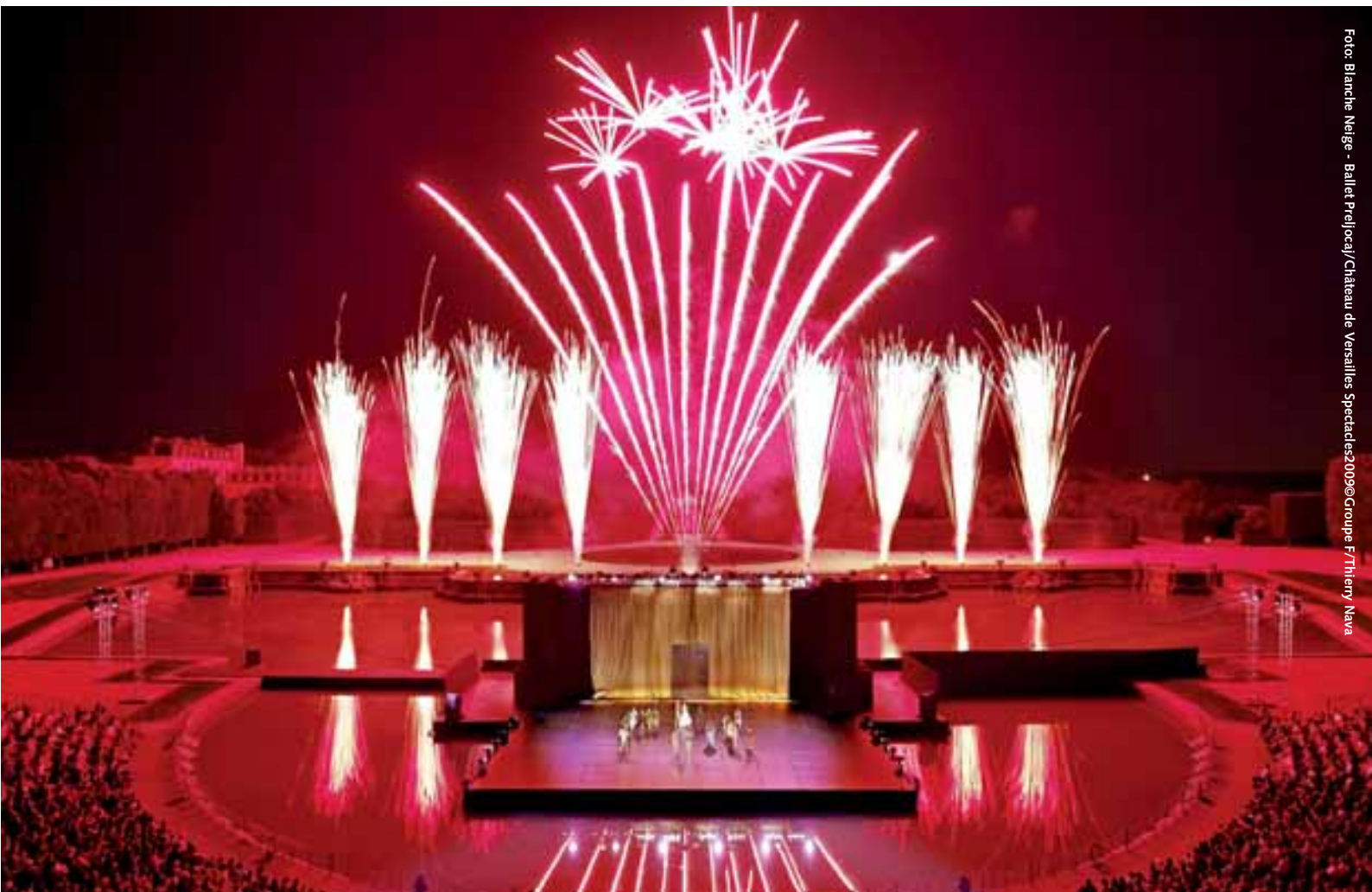
Foto: Blanche Neige - Ballet Preljocaj/Château de Versailles Spectacles2009©Groupe F/Thierry Nava

Incentive-Destination Frankreich – Feiern wie der Sonnenkönig