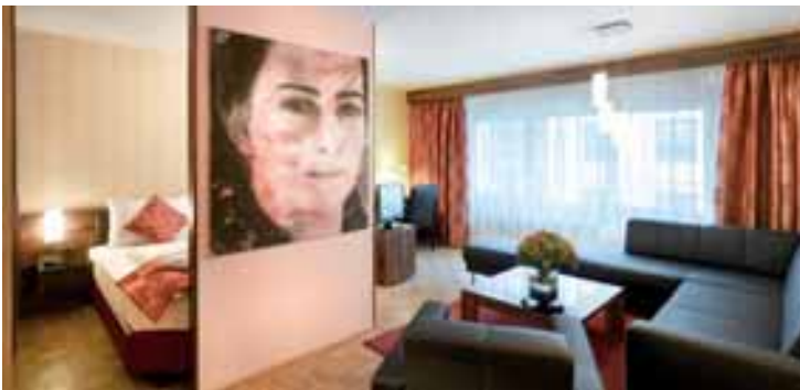
Mit den Derag City Apartments im Zentrum Wiens steht Geschäftsreisenden neben dem 4-Sterne-Haus Kaiser Franz Joseph, das über 400 individuell eingerichtete Serviced Apartments und Suiten umfasst, eine zweite exklusive Derag-Adresse mit 30 bestens ausgestatteten Residenzen zur Wahl

Nach aktueller VDR-Studie dauerten 2008 bereits mehr als 20% der von deutschen Unternehmen durchgeführten Geschäftsreisen im Schnitt länger als vier Tage –