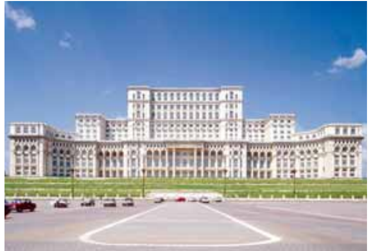
● Bukarest ist Rumäniens Wirtschaftszentrum – im Bild: der Parlamentspalast

Das 5-Stern- JW Marriott Bucharest Grand Hotel liegt mitten in der Stadt, direkt beim Parlamentspalast. Es verfügt auf acht Stockwerken über 379 Zimmer, zwölf Konferenzräume, kabelloses Internet in allen Räumen sowie einen Fitnessclub und Spa zur Entspannung.