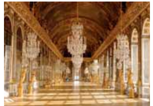
● Prunkstück des Schlosses Versailles: der Spiegelsaal

Außergewöhnlich, wenn auch nicht ganz so spektakulär, ist das relativ neue Angebot der „Académie Équestre“, der königlichen Reitschule vis-à-vis des Schlosses. Das (Standard-)Programm beinhaltet den Besuch der Stallungen, die Vorführung der Kunstreiterinnen auf den edlen Pferden mit spezieller Choreografie, sowie Fechtkunst und Bogenschießen, vorab ein Cocktail und als krönenden Abschluss ein Dinner-Bufferet inmitten der festlich transformierten Manege. Für nicht minder stilvolle Nächtigungen empfiehlt sich das nahe gelegene Trianon Palace Hotel, das erste Haus der Waldorf Astoria Collection in Frankreich.