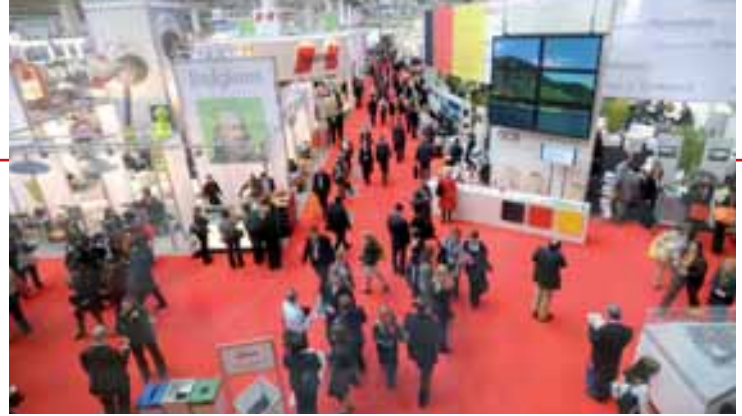
Die IMEX 2010 findet heuer vom 25. bis 27. Mai in Halle 8 der Messe Frankfurt statt

Die Hotelbiz für Seminarplaner wird am 20. 4. 2010 von 13.00 bis 21.00h im MAK Wien abgehalten, wo in entspannter Atmosphäre über die Programme der Seminar- und Tagungshotels, Veranstaltungsorte und Regionen informiert wird. Das Ausstellerverzeichnis ist unter www.hotelbiz.at nachzulesen.