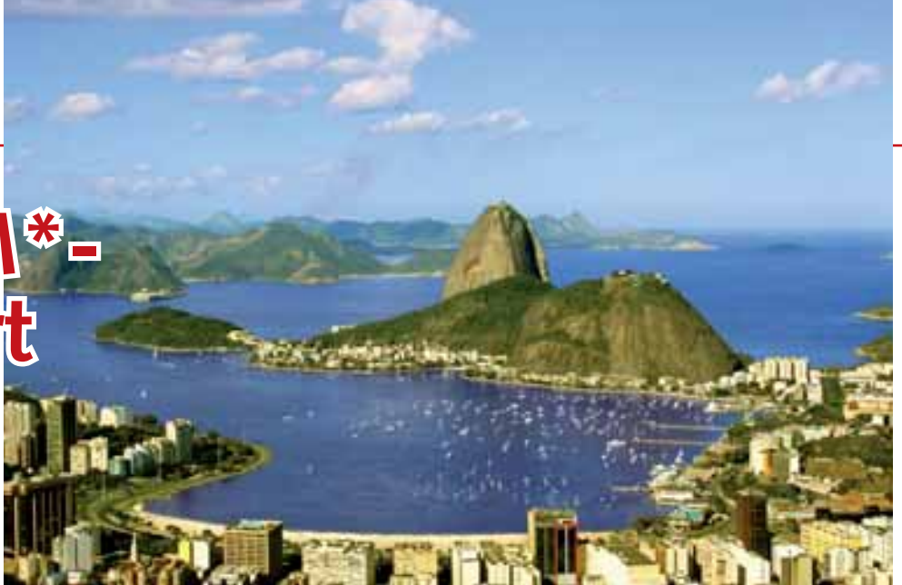
● Rio de Janeiro – beehrter Treffpunkt der Geschäftswelt Brasiliens

Der Karneval in Rio de Janeiro, die Wasserfälle von Iguazu oder der Regenwald Amazoniens. So kennt man Brasilien. Für Abwechslung ist in dem mit 8,5 Mio. Quadratkilometern und 192 Mio. Einwohnern fünftgrößtem Land der Erde gesorgt. Wer zum Geschäftstermin anreist, darf sich freuen: Hervorragende Infrastruktur, ein gutes Hotelnetz, praktische Flugverbindungen und eine breite Palette an Unterhaltung warten auf den Gast.